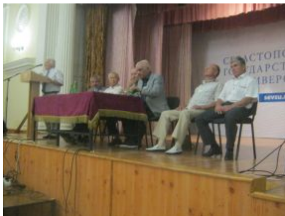
Президиум (ДНР, ЛНР, Армения)

проводится заседание Международного Союза машиностроителей. Кроме этого было предложено объединить усилия университетов Донецка, Луганска и Севастополя и провести 12 международных конференций в виде форума. Ученые из России, Казахстана, Армении,