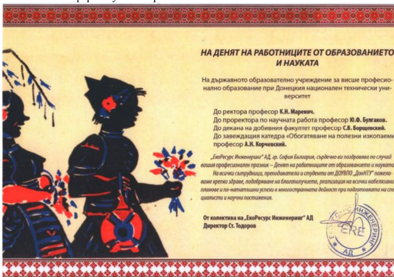
Поздравление от компании «ЕкоРесурсИнженеринг»

В канун день учителя ДонНТУ активно поздравляют наши партнеры из разных стран. Вот, например, нам прислали поздравление наши партнеры из «ЕкоРесурсИнженеринг» (г. София, Болгария.) Мы выражаем огромную благодарность нашим болгарским коллегам и надеемся на дальнейшее развитие отношений в сфере науки и образования.