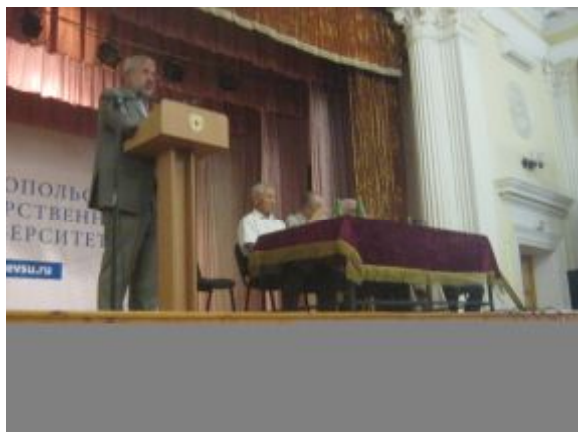
Открытие конференции

Михайлов Д.А, Мищук П.А., Петров М.Г. «Донецкая научная школа технологов-машиностроителей. Особенности становления и развития»;