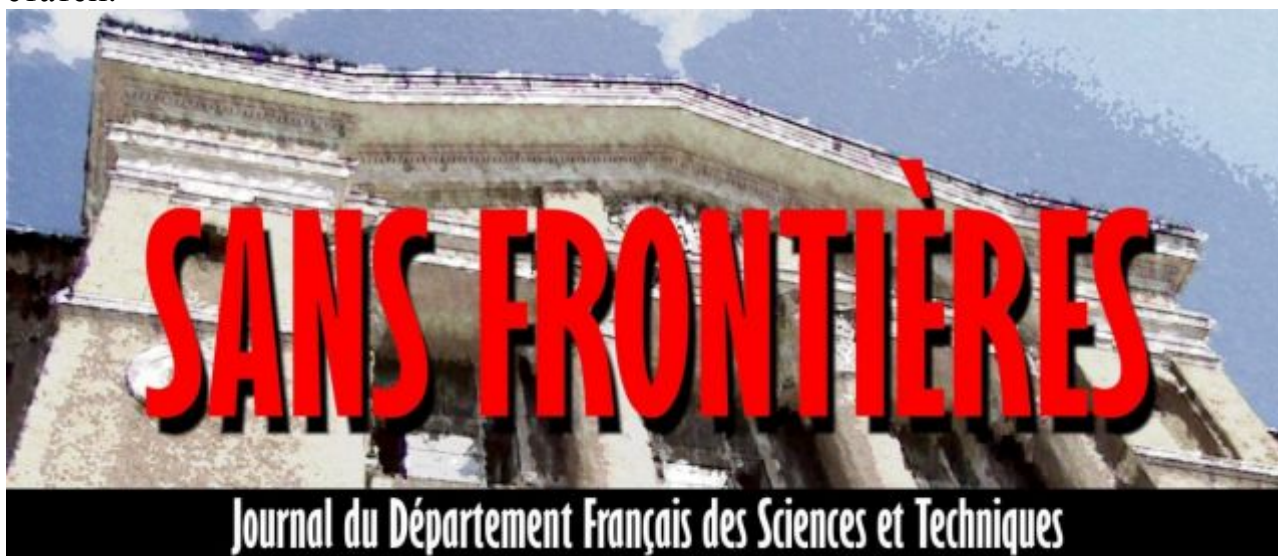
Логотип франкофонной газеты «Sans Frontières»

Вышел сентябрьский номер франкофонной прекрасно зарекомендовавшей себя газеты «Sans Frontières». Вашему вниманию одна из статей.