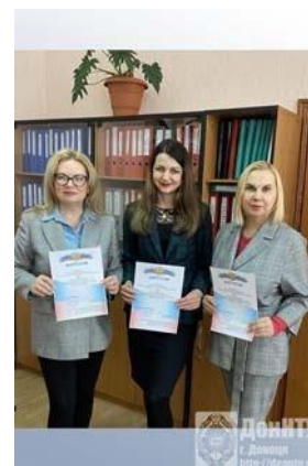
Преподаватели кафедры менеджмента и хозяйственного права инженерно-экономического факультета