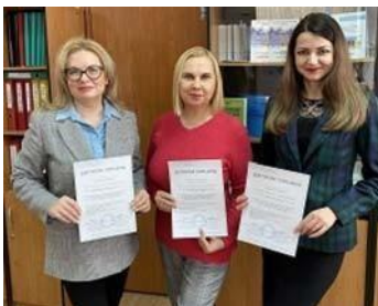
Преподаватели кафедры менеджмента и хозяйственного права инженерно-экономического факультета.